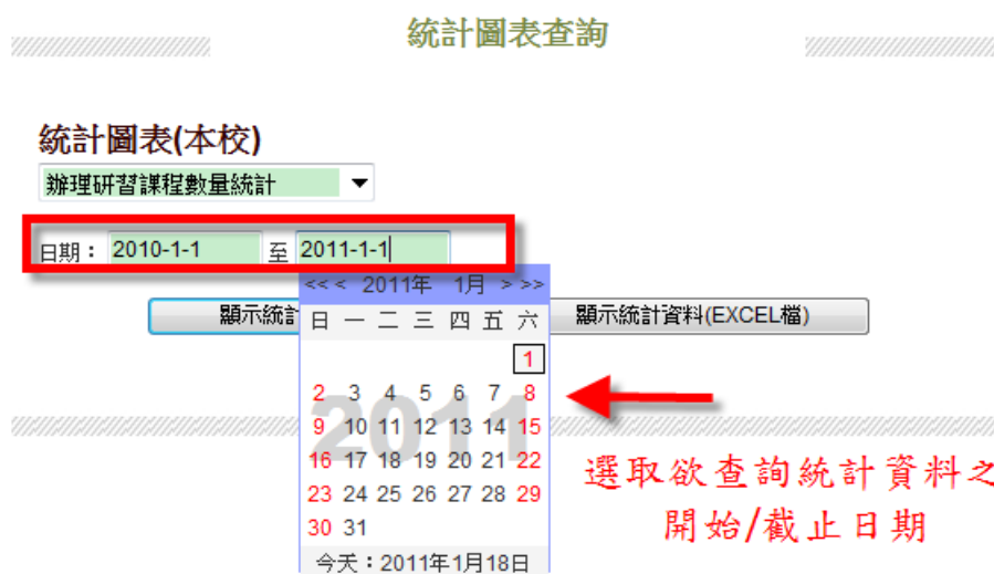
圖（三）選取欲查詢統計資料之開始/截止日期