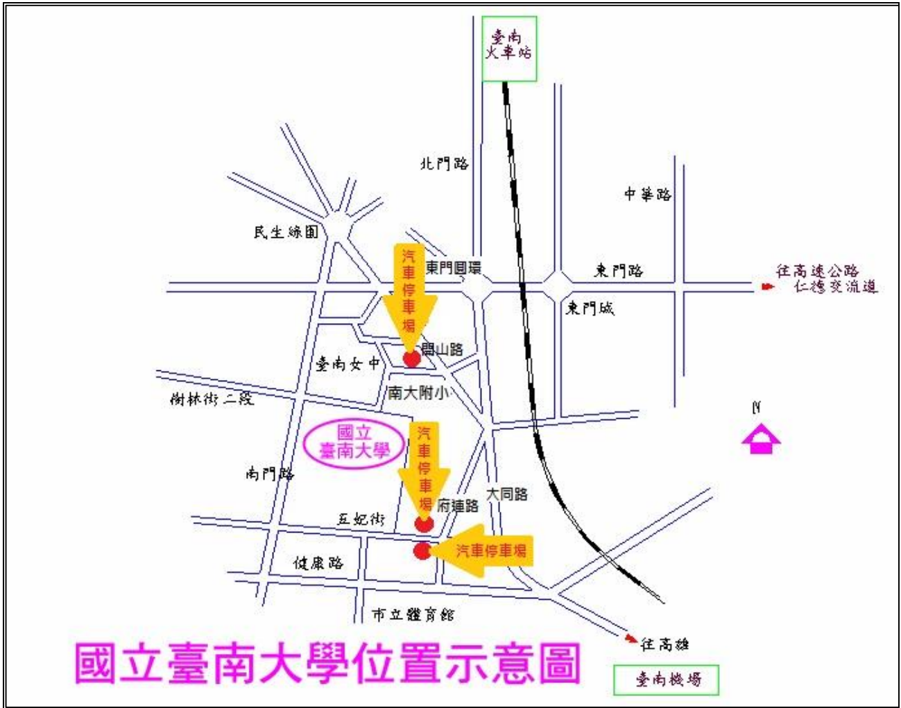
國立臺南大學位置示意圖